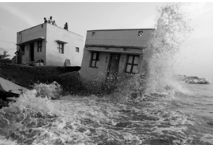
Selvaprakash Lakshman - Troubled Waters